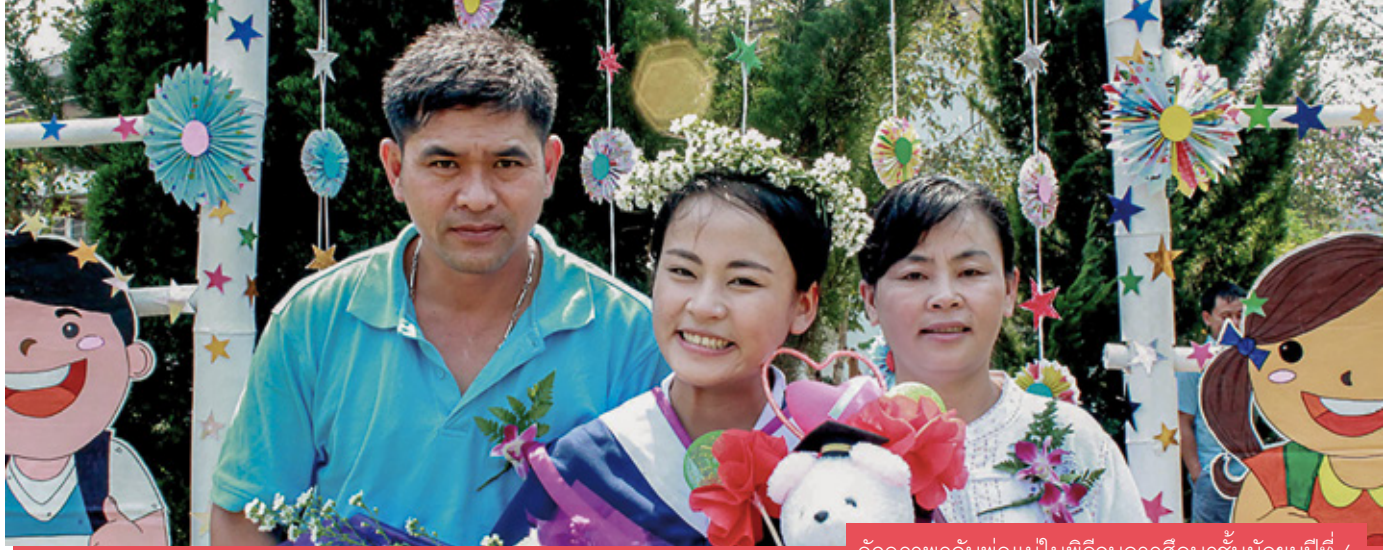
อัจฉราพรกับพ่อแม่ในพิธีจบการศึกษาชั้นมัธยมปีที่ 6